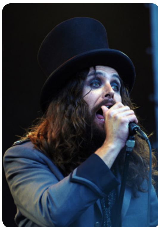
Bigelf - Sweden Rock Festival 2010

Nu började det blåsa så mycket så de flesta partytälten antingen slets iväg med vinden eller helt enkelt knäcktes. Vårat däremot, som inte ens var förankrat med stormsnören, stod som en fura och tjänade sitt syfte. Många frågade oss vad knepet var men vi vägrade avslöja detta. Mest för att jävlas skulle jag tro.