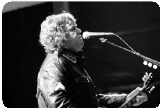
Gary Moore - Sweden Rock Festival 2010

Bigelf 7/10 Pugh Rogefeldt 8/10 Suicidal Tendencies 7/10 Billy Idol 8/10 Gary Moore 10/10