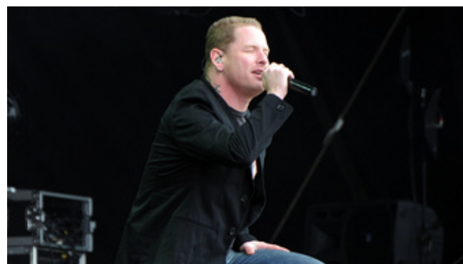
Stone Sour - Sweden Rock Festival 2010

Första festivaldagen är nu över och bjöd mig på tre kalas-spelningar. Hur skall detta kunna överträffas är min sista tanke innan jag kryper ner i min värmande sovsäck och däckar för en god natts sömn (vilket vanligtvis är endast ett par få timmar).