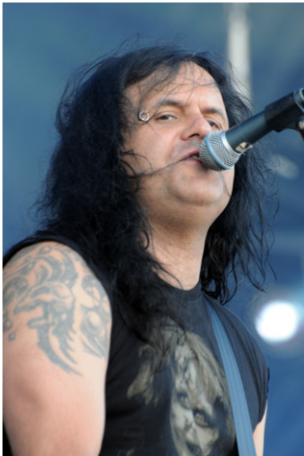
Kreator - Metaltown 2010

Nu lockade inte vare sig löjligt kassa Sonic Syndicate eller de tekniska dödsmetallarna i Cynic så egen medhavd rusdryck i en grässlant utanför området lockade mer innan det var dags att ta plats inne i Close Up-tältet igen. Under namnet Garcia Plays Kyuss kommer sångaren John Garcia med, för mig okända, musiker och lirar låtar från hans gamla band med just namnet Kyuss. Ett band många anser vara skaparna av stonerrocken. Då jag aldrig fick chansen att se detta favoritband när det begav sig så kunde jag inte låta detta tillfälle gå mig förbi. Bandet han har med sig är riktigt bra och känslan av coverband som kan infinna sig i fall som dessa märker jag aldrig av. Dom får till och med briljera lite i några instrumentala nummer där sångaren Garcia inte ens är med på scenen. Men den givna centralgestalten är trots allt herr Garcia själv som med självklar pondus och fantastisk röst får mig att bli smått rörd och glädjetårarna är inte långt borta. Jag tror inte jag saknad en enda låt av mina favoriter och de absoluta topparna är de riktiga ökenklassikerna som "Gardenia", "Asteroid" och avslutande "Green Machine" naturligtvis.