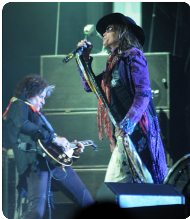
Aerosmith - Sweden Rock Festival 2010

Det halvvarv vi fick snurra tidigare fick vi snurra igen för Festival Stage lockade än en gång. Det var Aerosmith som återigen skulle förära oss ett besök och efter deras smått magnifika spelning på festivalen för tre år sedan så var förväntningarna så klart höga. Jag önskade mig mer sjuttio-talsmaterial än förra gången och fick i viss mån det men ändå kändes detta som ett liknande gig som sist. Dock är det ett av de mest professionella band vi får bevittna denna helg. Efter en stabil och publikfriande inledning med "Love in an Elevator" och "Back in The Saddle" så släpper dom aldrig taget om publiken trots några sega solon och mindre uppskattade låtar som "Jaded". Man kan liksom inte misslyckas med låtar som "Kings and Queens", "Sweet Emotions" och "Draw the Line" men utan en så självklar frontman som Steven Tyler så kunde det ha blivit en stel kväll. Han kan det där med att ta en publik men så har han många års erfarenhet av det också. När sen bandet avslutar med "Dream On", "Walk this Way" och "Toys in the Attic" så råder det inga tvivel om att även detta är en kalasspelning med Aerosmith. Men trots några fler sjuttio-talsnummer än senast så kan dom inte toppa sig själva tyvärr.