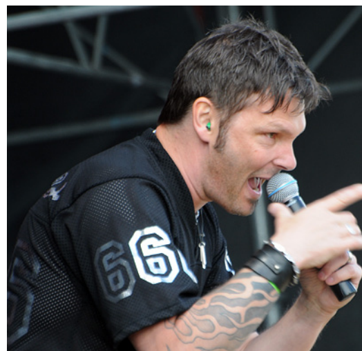
Dream Evil - Sweden Rock Festival 2010

Nu var det dags för lite middag och en vända upp till tältet men innan det hann vi se Dream Evils avslutning med "The Book of Heavy Metal" på Sweden Stage. En av metalvärldens kanske coolaste låtar och det verkade som även den stora publikskaran tyckte det samma som glatt sjöng med i refrängen.