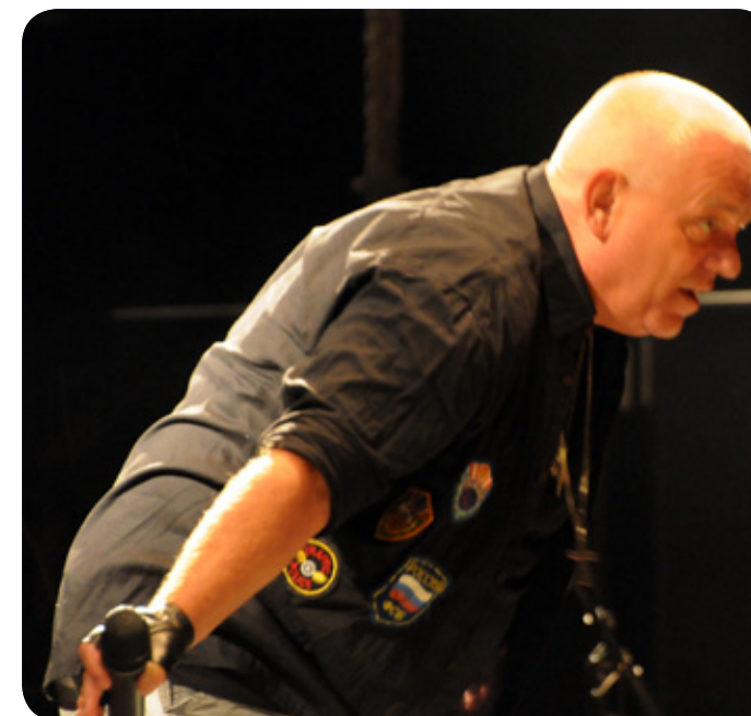
UDO - Sweden Rock Festival 2010

Först ut på Sweden Rock detta år var vinnarna i tributeband-tävlingen men vi siktade in oss på Sator istället som första akt att se detta år. Dessa Borlängegrabbar har jag lyssnat på sedan jag var liten grabb men jag har aldrig sett dom tidigare så det var ett efterlängtat möte för min del. Bandet visar även upp sig från sin bästa sida och funkade fint som festivalöppnare på Sweden Stage med sin punkiga partyrock. Dom sätter tonen direkt och levererar ett koppel av hits med bland annat "We're Right, You're Wrong" och "I'd Rather Drink Than Talk" ihop med andra guldkorn som "Pigvalley Beach" och "Slug it Out". Även Joey Ramone-hyllningen "Goodbye Joey" sitter där den ska men mest jubel drar naturligtvis "I Wanna Go Home" ner. Jag småmyser ikapp med bandet som är på ett strålande spelhumör och den månghövdade skaran människor som släpat sig ner till området för att bevittna bandet skriker efter mer långt efter att bandet gått av scenen. Jag är inte sen med att skandera efter mer jag också för jag fick nämligen inte höra min favorit – "Kiss of the Rat"! Men man kan väl inte få allt tänkte jag och var istället glad över att festivalen var igång och att jag äntligen fått se Sator live.