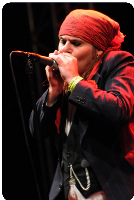
Quireboys - Sweden Rock Festival 2010

Då inget nämnvärt lockade på schemat den närmaste tiden så prioriterades nu tältet och uppladdning inför kvällens två sista akter. Det var ett klokt val för när väl The Quireboys gick upp på den nydöpta Dio Stage och sångare Spike skanderade "We are Quireboys and this is rock'n'roll" så var alla i gänget på topp och sicken fest det blev! Bandet kastar oss rakt in i ett saligt rus med "Bite the Hand that Feeds" samt "Have a Little Play" och tvekar inte för att riva av "Tramps and Thieves" tidigt i setet. Bandet har en härlig fart på scenen och tillsammans med en partysugen publik samt ett av de bästa ljuden jag har upplevt på festivalen någonsin så är detta på väg att bli en av festivalens höjdpunkter. Den uppfattningen tar sen än mer fart då de bränner av svängiga "7 O'Clock" strax innan extranumret med "I Don't Love You Anymore" och kåtslaget "Sex Party". Detta, mitt första, livemöte med The Quireboys blev precis så bra som jag hade vågat hoppats på och festivalens bästa spelning är alltså redan avklarad?