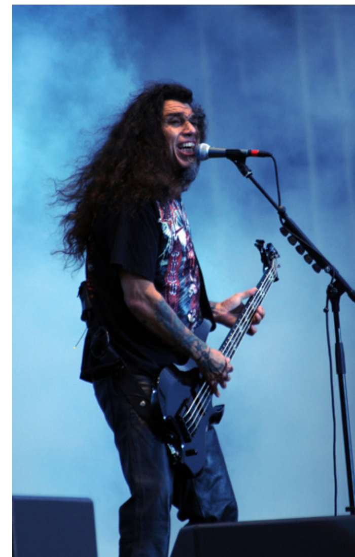
Slayer - Sweden Rock Festival 2010

Glenn Danzig visade inga tecken på ringrostighet även om han i vissa snabbare nummer fick kämpa lite mer än vad han är van vid men detta påverkade inte helhetsintrycket nämnvärt. Herr Danzig visade prov på att han fortfarande har en av rockens coolaste röster i behåll!