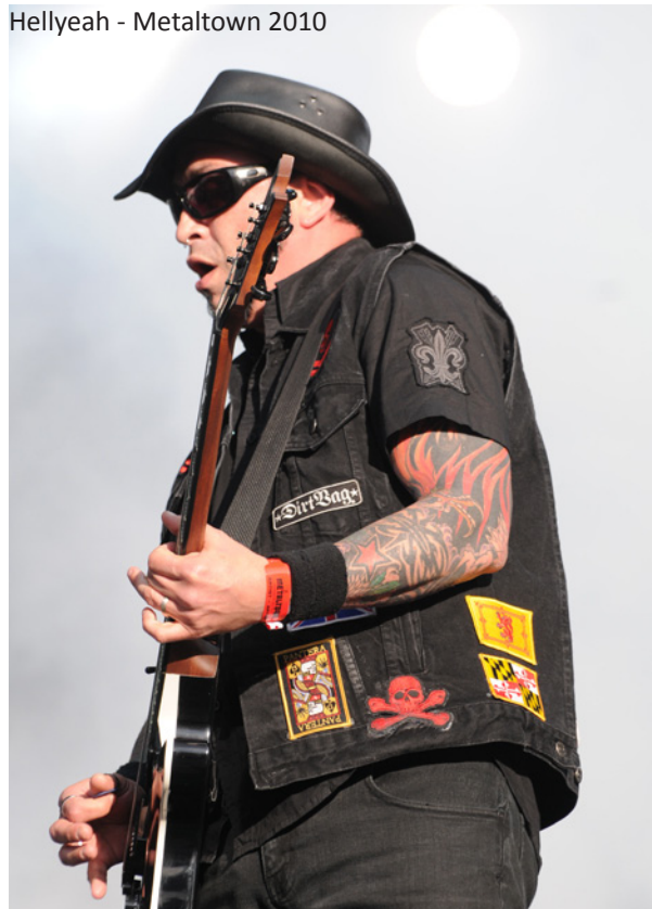
Hellyeah - Metaltown 2010

Desto större skara var samlad framför den mindre av de två utomhusscenerna och hur walesiska Bullet for My Valentine kan ha blivit så populära övergår mitt förstånd. Dom har helt klart ett gäng riktigt ettriga och coola thrashriff som till exempel i "Scream Aim Fire" men de skall ju hela tiden förstöra med mesig sång och poprefränger. Som tur är ljudet så lågt och dåligt att sången ibland försvinner. Dom spelar inte mycket mer än halvtaskig popmetal enligt min uppfattning och då hjälper det inte hur bra fart dom har på scenen eller hur snygg (och i detta fall enkel men effektiv) ljussättning dom har. Men kidsen verkar gilla det och jag får väl finna mig i att inte alla har samma goda smak som jag har.