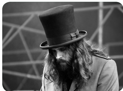
Bigelf - Sweden Rock Festival 2010