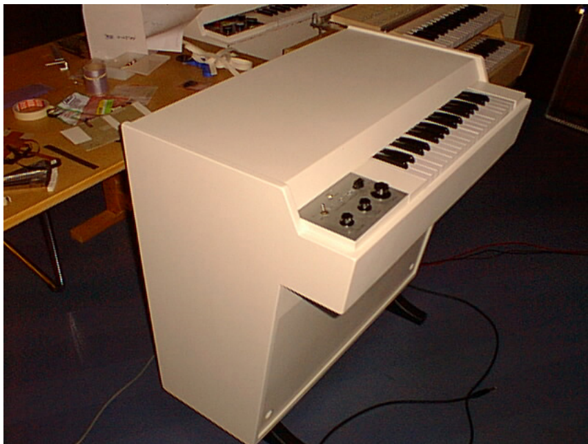
En bild på den klassiska modellen Mellotron M400 (tagen från länken ovan).

Det som gör Mellotronen så otroligt intressant är i grund och botten den tekniska konstruktionen som i praktiken gav vem som helst utan större musikalisk skolning (och med tillräckligt tjock plånbok!) möjlighet att leka symfoniorkester eller fördenskull kör eller brassband. Nick Awde ägnar märkligt nog endast 40 sidor i sin nästan 600 sidor tjocka bok åt att beskriva maskinens historia, konstruktion och funktion. Men det räcker faktiskt att ta en titt på de två faktabladerna i början av boken under rubriken ”Method behind the Madness or, How a Mellotron works” för att få en väldigt bra uppfattning om vad det är för en tingest.