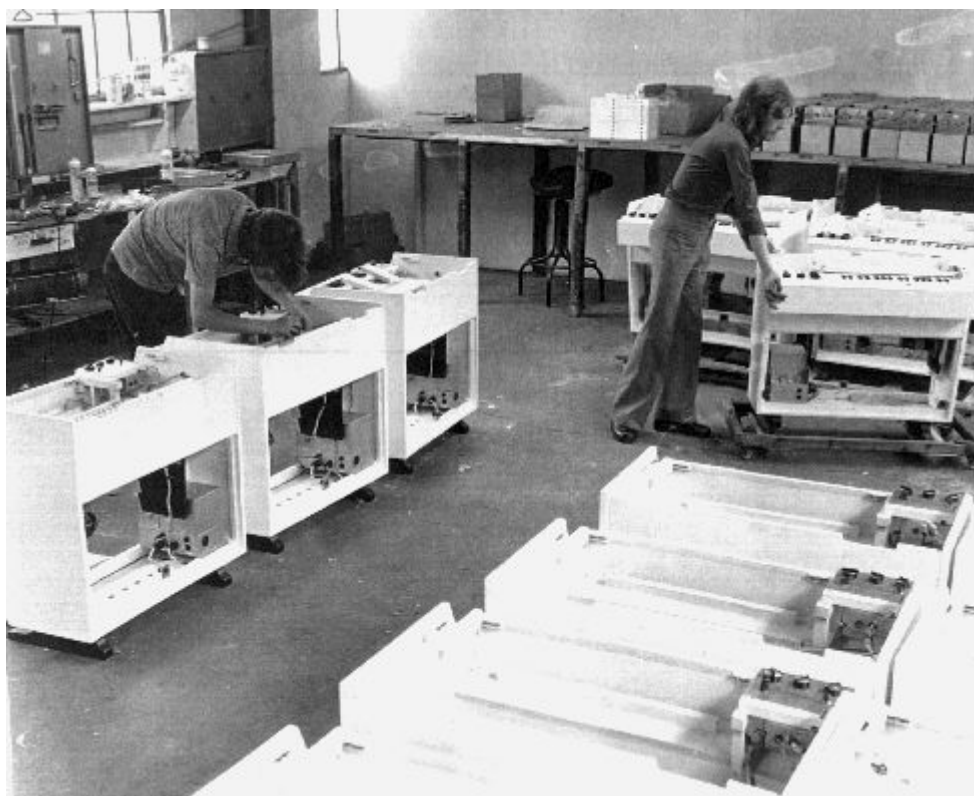
En bild från fabriksgolvet under glansperioden där man också kan se bilder på männen bakom företaget Streetly Electronics.

faktiskt inte slut där utan läs mer sedan om fortsättningen i de två avslutande avsnitten. Totalt producerades cirka 2500 maskiner under denna Mellotronens glansperiod.