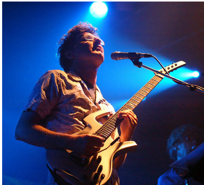
Roine Stolt live med The Flower Kings.

Bland de mer moderna Mellotron-användarna finns en intressant intervju med "vår egen" Roine Stolt från The Flower Kings. Här berättar han om hela sin musikaliska uppväxt i Uppsala och hur han via Genesis-likelike-bandet Kaipa hamnade i progrockfåran. Därefter beskriver han hur han efter ett lite småtråkigt 80-tal med diverse studiomusikerjobb sedan på egen hand skapade The Flower Kings från ingenting hemma i sin studio och fick det att växa till det kanske största Progrock-bandet som finns just nu sett i ett internationellt perspektiv. I Sverige är det inte många som känner till dem men när det hålls konserter här så kan det hända att fans kommer hitresande från Japan vilket ju är tämligen fascinerande. Roine uttrycker en djup beundran för 70-talsbanden och kanske särskilt för band som Yes och Genesis. Han understryker speciellt att det var melodierna som var grejen – inte instrumentuppsättningen. Med det vill han ha sagt att det är dömt att misslyckas om man sätter ihop ett progrockband med den klassiska sätningen trummor, gitarr, hammondorgel och Mellotron och tror att det är den magiska formeln (ibland brukar man även nämna "The fantastic four keyboards = MELLOTRON+MOOG+HAMMOND+TAURUS som det allra viktigaste). Har man inte melodierna så funkar det inte alls.